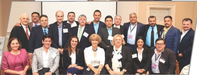
Mitglieder der mexikanischen Ortsgruppe 85 mit Agentur-Partnern