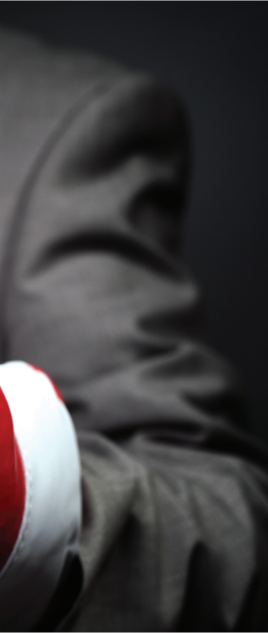
POR ALLEN DORIN, JR., MAI, SRA, R/W-NAC

S e podría pensar que dos tasadores profesionales que reciben los mismos parámetros para tasar un bien llegarían a valores similares o, al menos, estarían de acuerdo con valores sobre los cuales se podría basar un acuerdo transaccional. Sin embargo, en la mayoría de los casos, esto no ocurre.