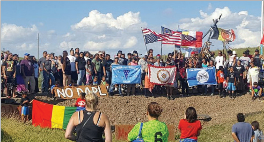
パン・インディアン運動が普及し、部族や地元の同盟の枠組みを越えて、異なるアメリカ先住民グループの結束が促された。先祖代々の土地には新しい村ができ今では4千以上存在する。

さらに、それらの議論により、たとえ計画の指針への合意は生まれなかったとしても、互いに意見を一致させていく機会は得られたであろうし、アメリカ陸軍工兵隊の出す許可に関する法的なあり方がここまで議論にさらされることもなかったであろう。