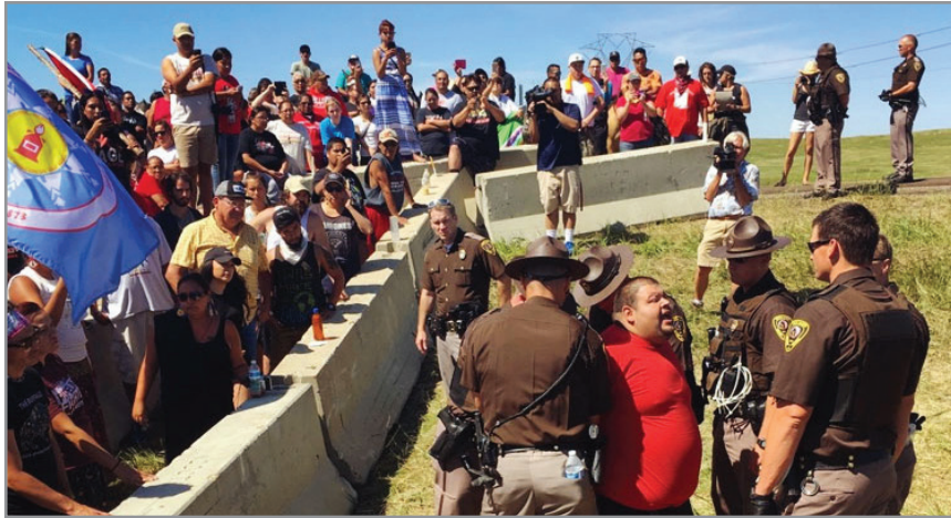
建設が始まると、企業側が警備員と番犬を配置し、抗議参加者と対峙したため、問題が全国レベルで取り上げられるようになった。